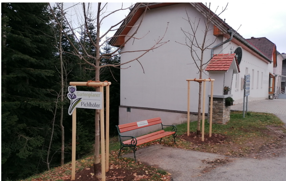
Kastanienbäume bei der Bücherei

Die Eröffnung ist für 1. Juni 2024 beim Almauftrieb auf der Vorauer Schwaig geplant.