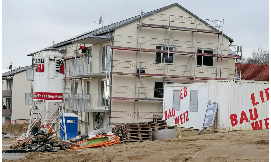
Wohnhaus der ÖWG

Die Arbeiten wurden im Herbst durchgeführt, sodass der weiteren Bebauung in diesem Bereich nichts mehr im Wege steht. Für die Bebauung des Grundstückes wurde ein Architekt-