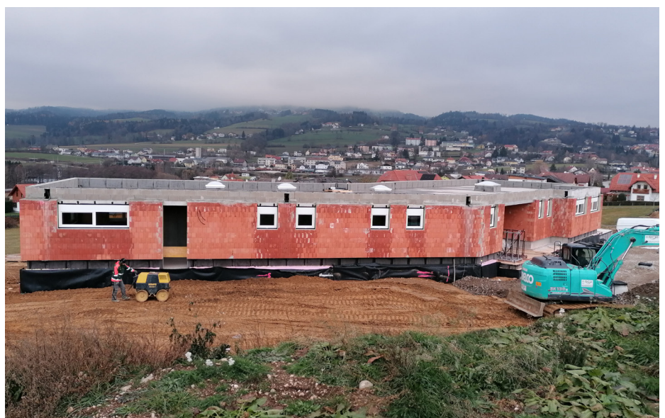
Errichtung neue Ortsstelle Rotes Kreuz Friedberg

Der Bebauungsplan und die Aufschließung sollen im Jahr 2024 beschlossen bzw. durchgeführt werden. In diesem Bereich wollen wir auch Grundstücke