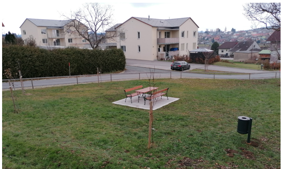
Sitzgelegenheit und neue Obstbäume - Bereich Loiblsiedlung Bahnhof

Die Feistritzwerke haben im Herbst ein Erdkabel für die Stromversorgung auf der Hauptstraße (vormals Hochstraße) vom Transformator im Gewerbepark neu verlegt. Hierbei wurde auch ein Stromkabel für eine Straßen-