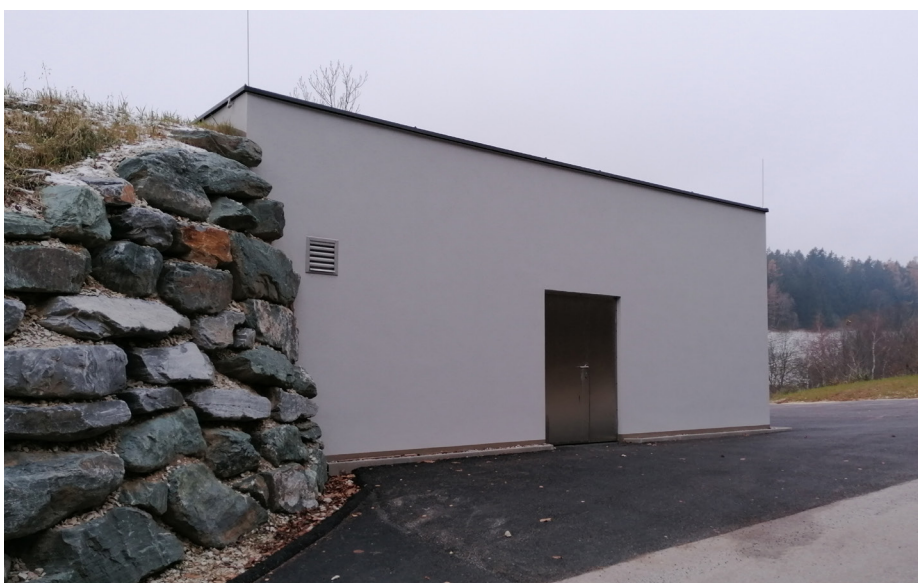
Neuer Hochbehälter in Schwaighof

Beim neuen Hochbehälter wird auch eine Ladestation für E-Fahrräder und ein Trinkbrunnen errichtet, da der Zu-